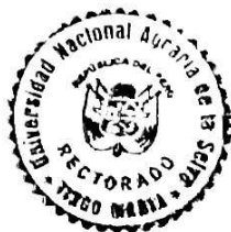
EFRAIN ELÍ ESTEBAN CHURAMPI RECTOR