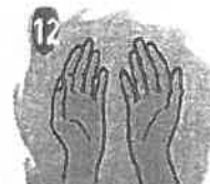
Manos limpias. Vidas saludables.