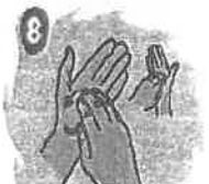
8 Frote la yema de los dedos contra la palma, repita el mismo ejercicio con la otra mano