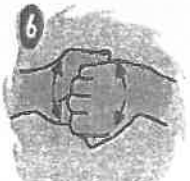
6 Empuja la mano y frote los dedos de arriba hacia abajo