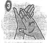
3 Frote sus avanos con la palma