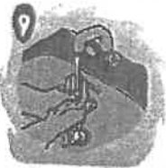
9 Enjuague las manos con abundante agua