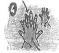
4 Frote la palma sobre el dorso de la mano