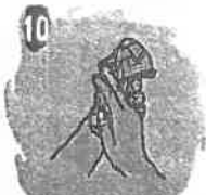
10 Seque bien sus manos