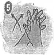
5 Frote palma con palma con los dedos entrelazados