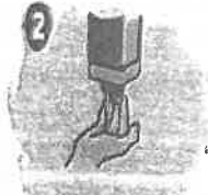
2 Aplique jabón sobre sus manos húmedas