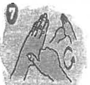
7 Frote los dedos rotándolos uno por uno